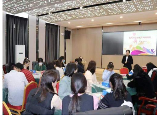
(图为子公司举办的文体活动)

公司在员工生日当天送上生日贺卡和生日蛋糕，在元旦、春节“两节”慰问困难职工，送去公司的关怀，对生活困难的职工家庭进行帮扶，将“以人为本”的理念落到实处，推动实施员工关爱计划，让发展成果惠及每位员工。