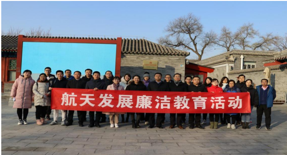
（图为公司领导及重点岗位人员接受廉洁教育）

公司落实纪委书记专职化，明确了纪委书记、专职纪检干部的岗位职责，为强化纪检监察职能提供了组织保障。公司与各子公司党政负责人签订《航天发展公司反腐倡廉责任书》，与财务、营销、采购等重要岗位人员签订《廉洁从业承诺书》。严格落实中央“八项规定”及其实施细则精神，开展涉及公务用车、办公用房、各种消费卡等专项检查，系统清理“四风”现象。严格内部审查，确保各项工作能够得到有效监督，公司与供应商保持了长期共赢的合作模式，努力杜绝各项公务接待中的铺张浪费行为和形式主义作风。这些措施有效防范了商业贿赂、不正当交易的发生。